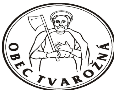
OBR. Č. 4: PEČAŤ OBCE TVAROŽNÁ

V pečati sa vyskytuje horná časť postavy svätého Mateja odetého v plášti, s gloriolou okolo hlavy, ako drží v pravej ruke sekeru opretú o plece.