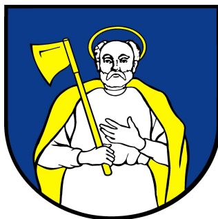
Obr. č. 2: Erb obce Tvarožná

Svätý Matej apoštol je patrónom farského rímskokatolíckeho kostola.