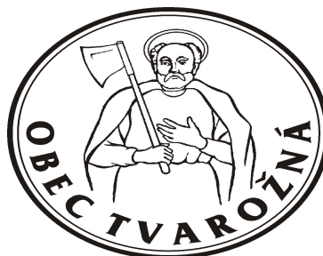
OBR. Č. 4: PEČAŤ OBCE TVAROŽNÁ

V pečati sa vyskytuje horná časť postavy svätého Mateja odetého v plášti, s gloriolou okolo hlavy, ako drží v pravej ruke sekeru opretú o plece.