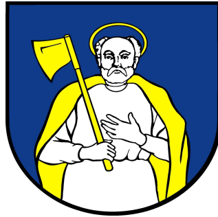
Obr. č. 2: Erb obce Tvarožná

Svätý Matej apoštol je patrónom farského rímskokatolíckeho kostola.